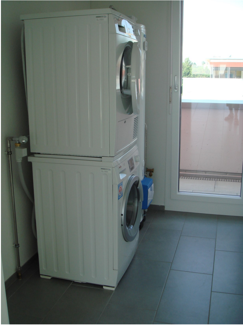
Waschmaschine Tumbler im Reduit